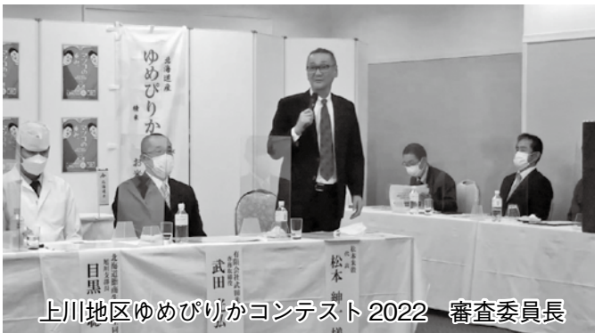
上川地区ゆめぴりかコンテスト2022 審査委員長