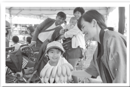
バナナが当たったヨ!!