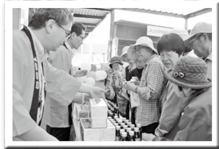
人気の配置薬コーナー

愛別地区の第11回組合員大感謝祭を色彩選別特設会場で組合員約240名の参加をいただき開催しました。 当日は、天候にも恵まれイベントや焼き肉・地元産手打ちそばなど組合員の楽しく声弾む感謝祭となりました。