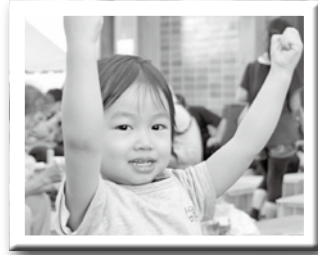
かわいい仲間も参加してくれました