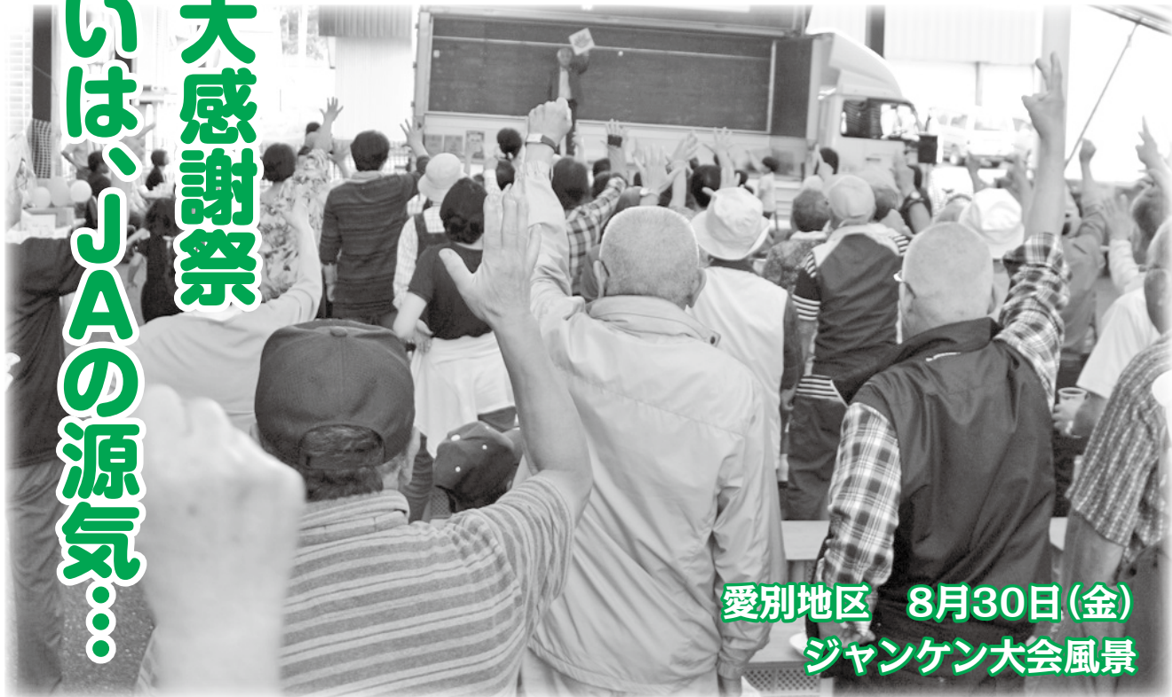
愛別地区 8月30日(金) ジャンケン大会風景