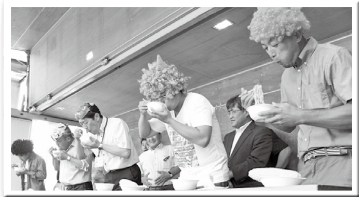
チーム対抗の早食い大会…そば・きのこ汁・とうもろこし