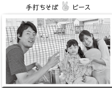
手打ちそば 🍴 ピース