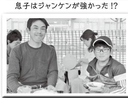
息子はジャンケンが強かった!?