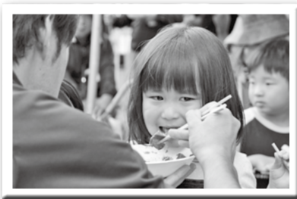
お肉美味しいけど、アツイね!?