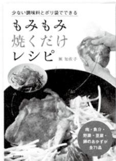
堀 知佐子 著 定価 1,404円

うちの庭は日があたらぬから…と諦めていた人は必見！日陰をいかし、あえて作り出すことで過酷な天候にも負けない美しい庭づくりの方法を紹介。日陰には向かない植物を美しく咲かせる方法もわかりやすい。