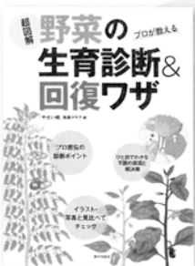
『やさい畑』 菜園クラブ 編 定価 1,620円