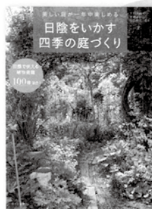
宇田川佳子・斉藤よし江・ 田口裕之 監修 定価1,512円

不調の原因と対処法がイラストと写真でひと目でわかる。病害虫だけでなく過繁茂や成育障害による不調など、プロが総合的に診断し状況を詳しく解説。回復方法もていねいに紹介。味&収量アップのコツが満載。