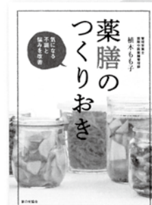
植木もも子 著 定価 1,296円

素材をポリ袋に入れて、もんで、フライパンで野菜と一緒に焼くだけで、あっという間に満足度の高い献立が完成する。超簡単にできる絶品レシピ。冷蔵庫で約5日間保存できるので、忙しい人にとくにオススメ。