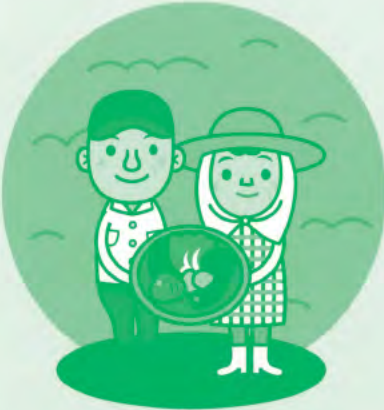
イラスト：ゆきたけし