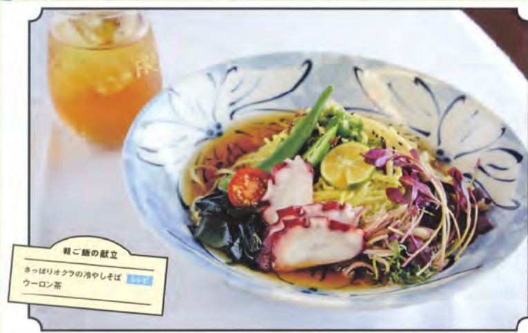
朝ご飯の献立 さっぱりオクラの冷やしそば ウロン茶