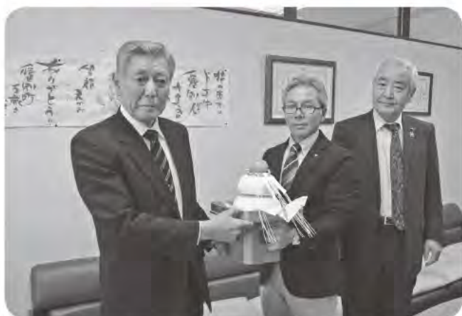
12月26日／愛別町米麦生産振興協議会より愛別町へ