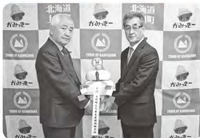
12月27日／上川町もち米生産団地組合より上川町へ