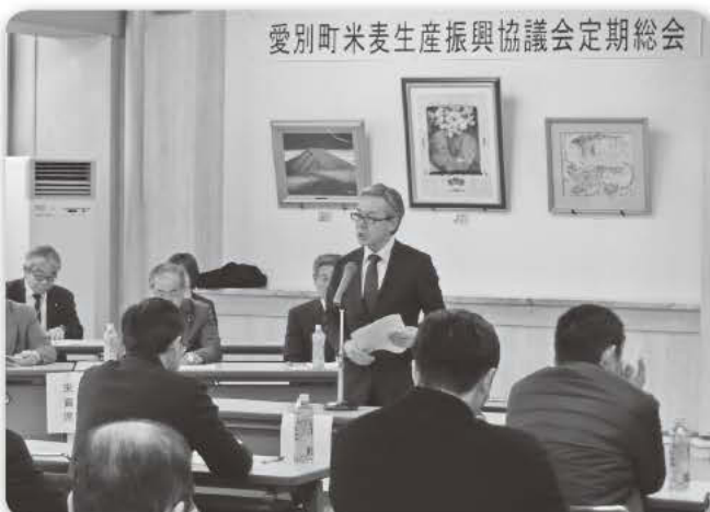
愛別町米麦生産振興協議会定期総会