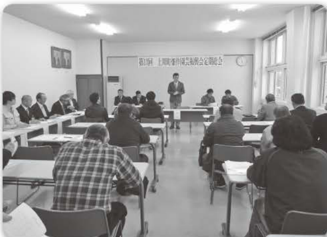
第11期 上川町畑作園芸振興会定期総会