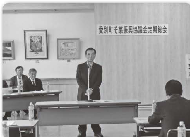
愛別町そ菜振興協議会定期総会