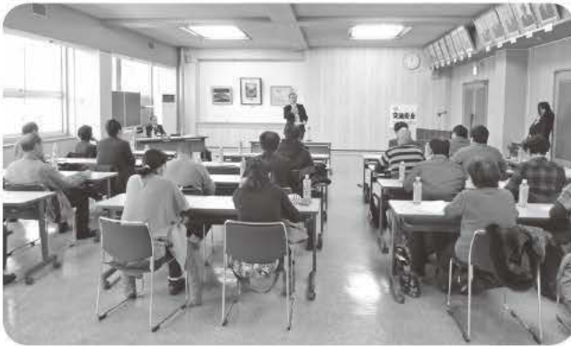
12月14日 愛別町農業青色申告会 平成28年度税務研修会