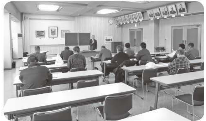
12月19日 愛別町農業者年金協議会 平成28年度代議委員会・研修会