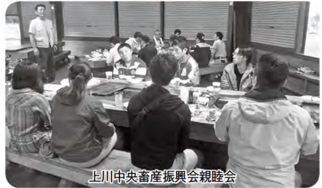
上川中央畜産振興会親睦会