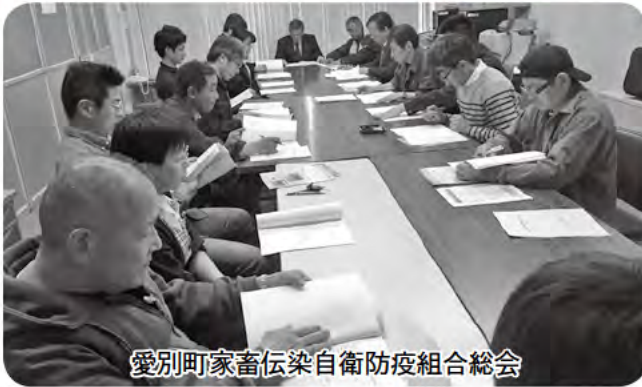
愛別町家畜伝染自衛防疫組合総会