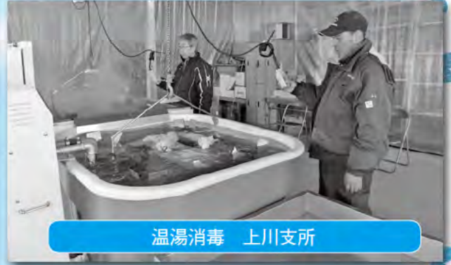
温湯消毒 上川支所