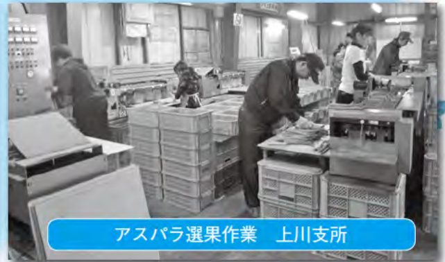
アスパラ選果作業 上川支所