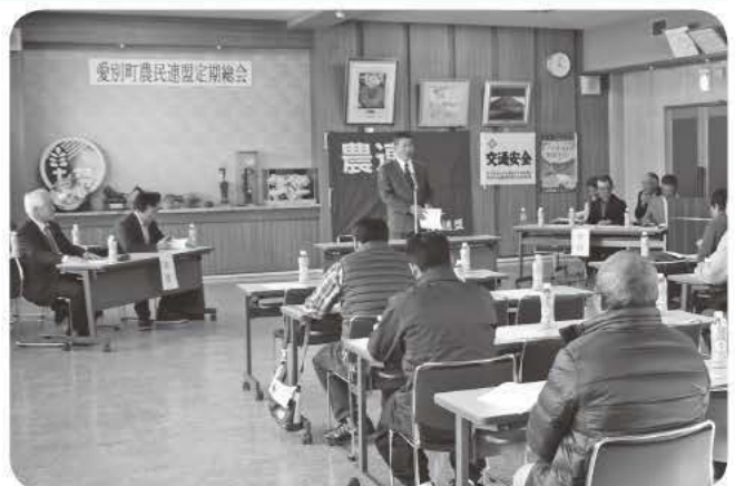
3月25日 愛別町農民連盟定期総会