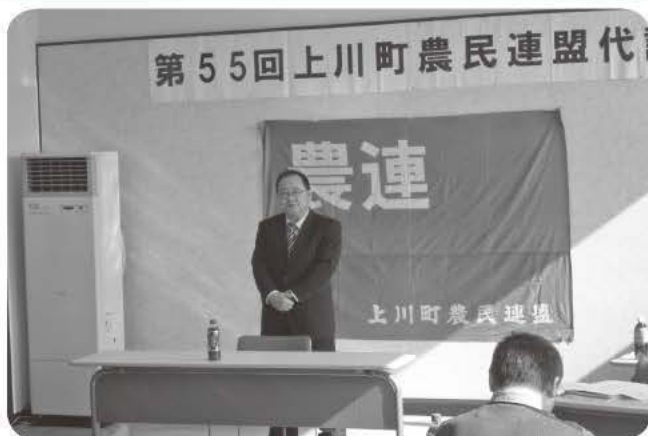
3月7日 上川町農民連盟代議員会