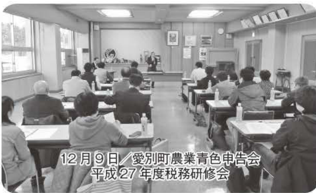
12月9日 / 愛別町農業青色申告会 平成27年度税務研修会