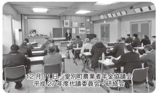
12月11日 / 愛別町農業者年金協議会 平成27年度代議委員会・研修会