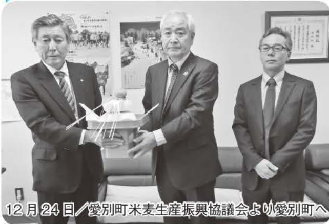
12月24日 / 愛別町米麦生産振興協議会より愛別町へ