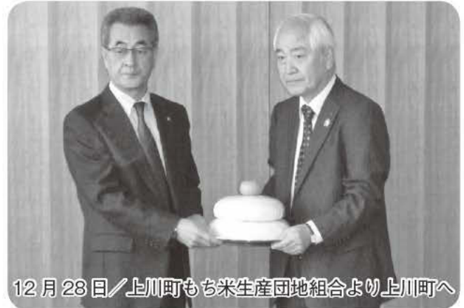
12月28日 / 上川町もち米生産団地組合より上川町へ