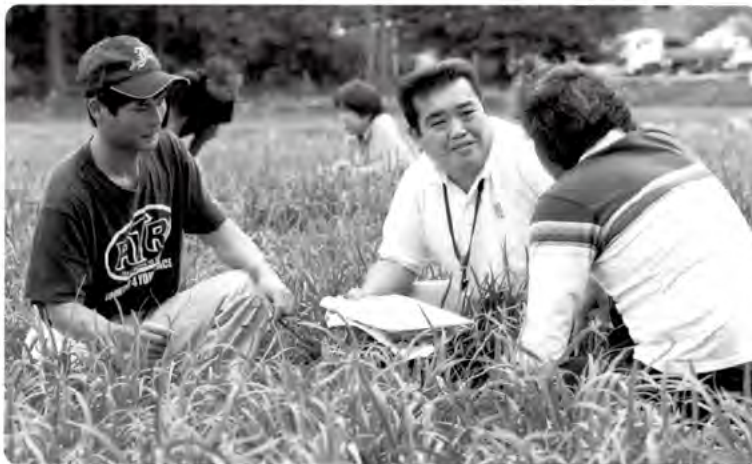
担い手の営農支援をするJAのTAC

現在、日本では行き過ぎた市場原理主義により、格差社会の拡大と地域経済の疲弊に拍車がかかっています。農業・農村にかかる課題は多くありますが、地域に根差した組織としての役割がJAに一層求められています。