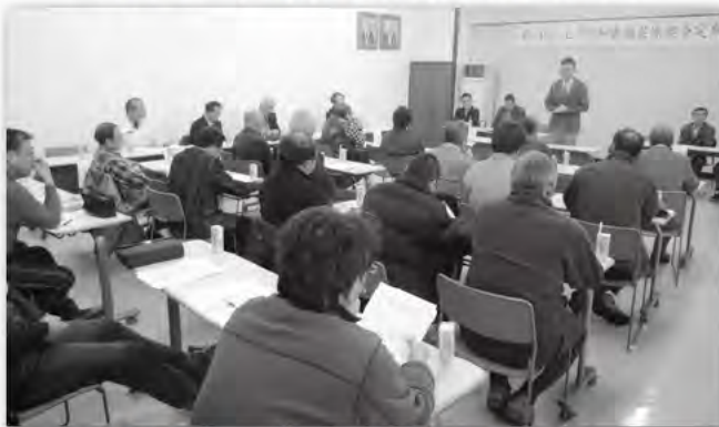
3月11日 上川町畑作園芸振興会定期総会