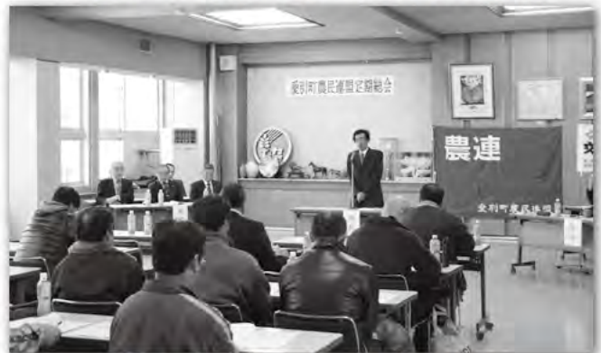
3月11日 愛別町農民連盟定期総会