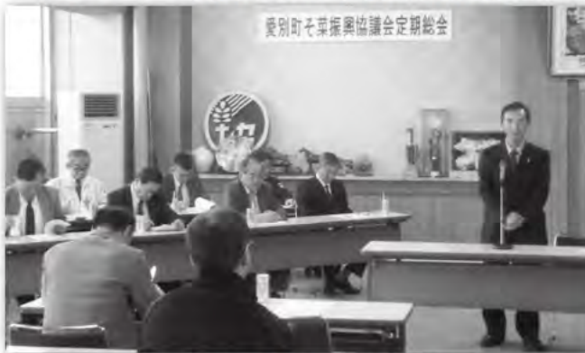
3月6日 愛別町そ菜振興協議会定期総会