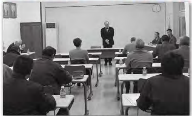
3月2日 上川町もち米生産団地組合定期総会