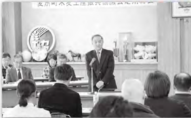
2月27日 愛別町米麦生産振興協議会定期総会