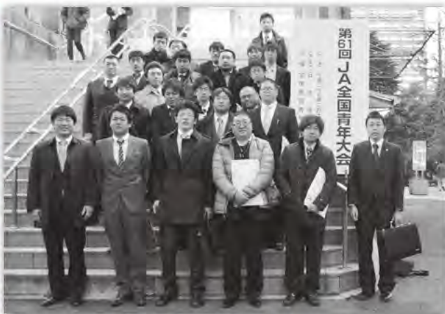
JA全国青年部大会（JA上青協）

講演の最後には生歌も披露され、プチコンサートのように会場が大いに盛り上がりました。