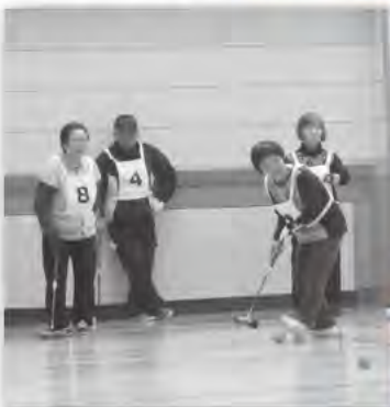
プレーに臨む皆さん

第29回愛別地区年金友の会ゲートボール大会が3月14日（土）農村環境改善センターにて開催されました。