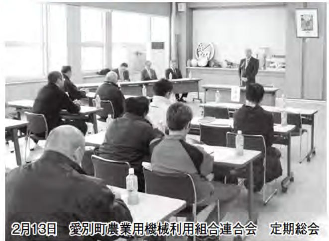
2月13日 愛別町農業用機械利用組合連合会 定期総会