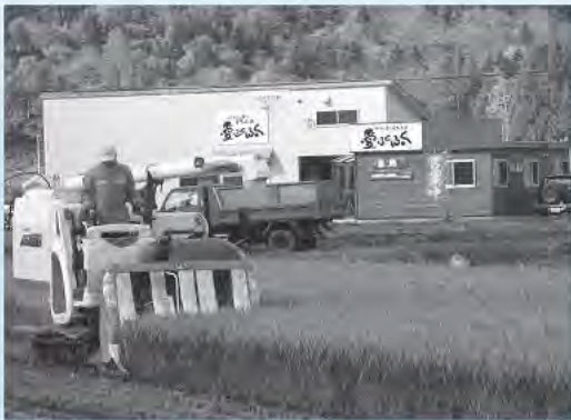
水稲刈り取り風景

農産物とその製造品を、安心・安全とともに消費者に提供することに努め、地域社会の繁栄に貢献し、衆知を結集して社業の発展と社員の幸福を追求する