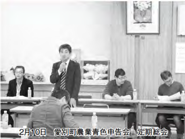
2月10日 愛別町農業青色申告会 定期総会