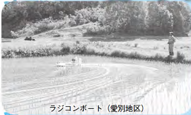
ラジコンボート（愛別地区）