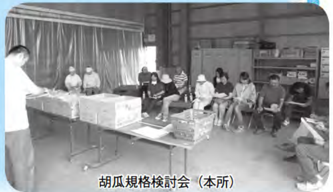
胡瓜規格検討会（本所）