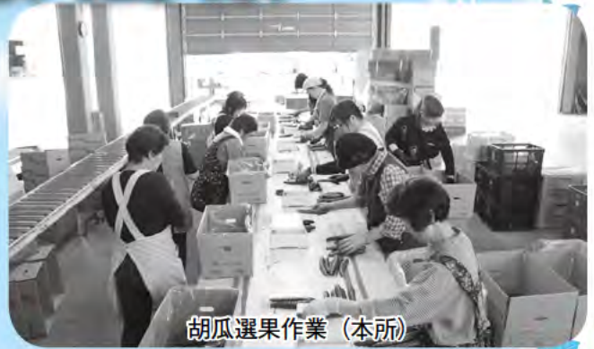
胡瓜選果作業（本所）