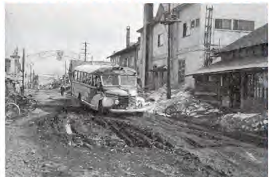
昭和36年町制施工で舗装される前、雪どけ時期の本町通り