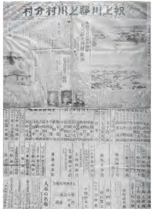
上川村分村の一報を伝える記事

近づき来る軍靴の響きの中で、村にも軍友会や大日本国防婦人会村分会などが設立され、人的にも物的資源の統制が始まりました。