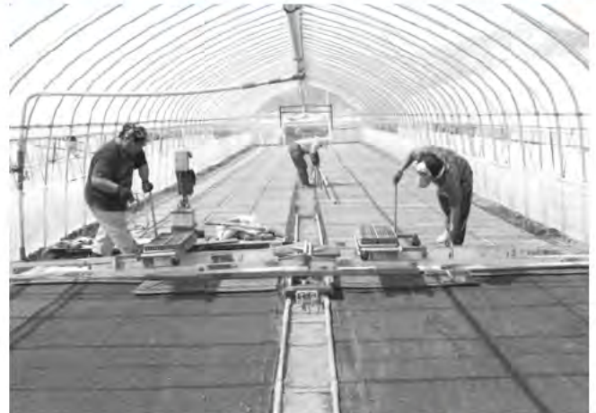
4月/粳蒔き作業(伏古地区 伏古生産組合)