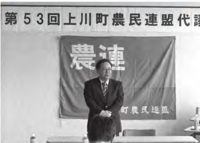
3月26日/上川町農民連盟代議員会