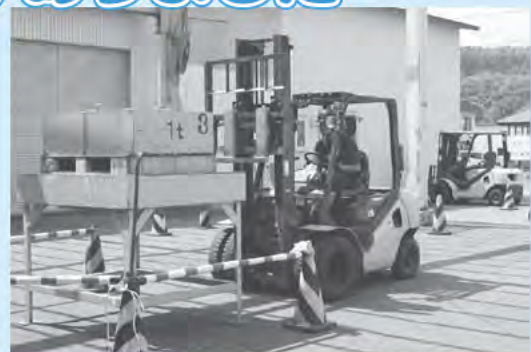
フォークリフト技能講習会 (JA 本所)