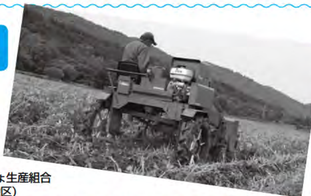
上川町馬鈴しょ生産組合 (菊水地区)