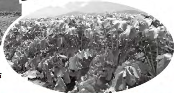
上川町大根生産組合 (菊水地区)