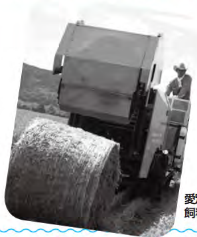
愛別町稲発酵粗 飼料部会