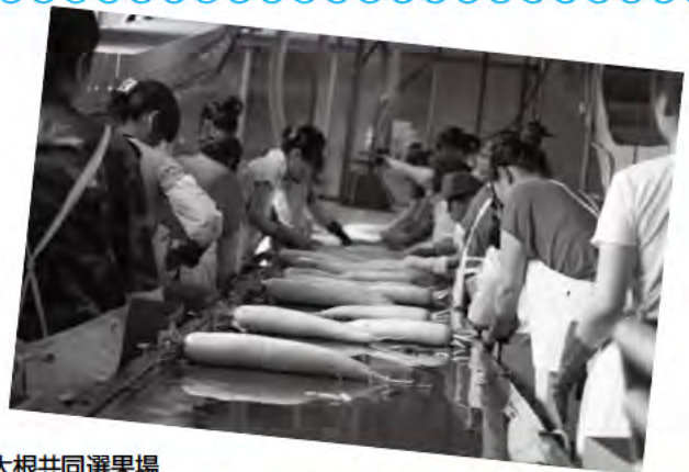
JA上川支所 大根共同選果場