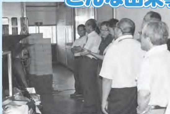
農協施設視察 (JA 役員)