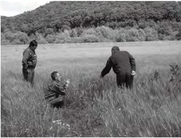
小麦視察研修会（上川地区）