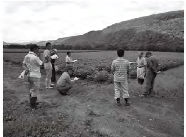
そば・大豆現地研修会（上川地区）