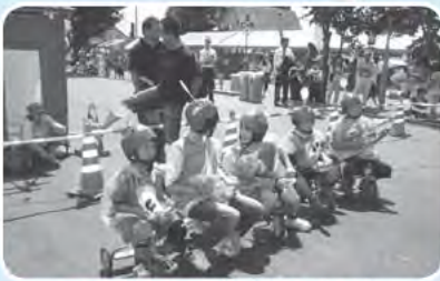
いざ出陣!! (愛別夏の陣)