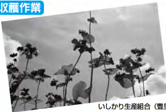
いしかり生産組合 (豊里地区)