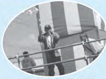
元大関旭国 (愛別町出身)