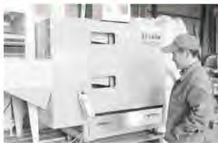
愛山地区 株式会社 愛／そば