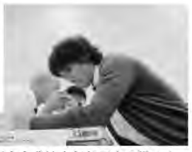
上川中央農協青年部同士の戦い!