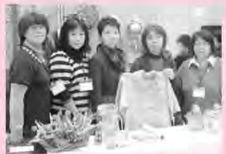
JA北海道女性リーダー研修会・北海道家の光大会