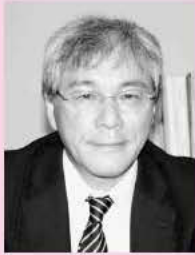
信用担当執行理事 兼 課長