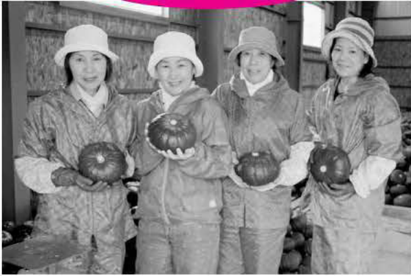
伏古地区／伏古生産組合