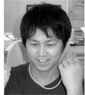
係 端場 巨 農産物集荷、販売