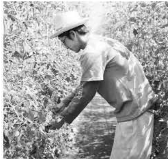
ミニトマト管理作業