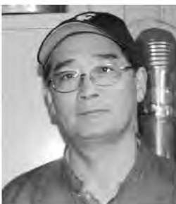
係 (準)阿木 潔 堆肥センター業務