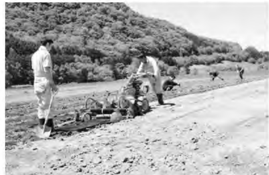
上川支所育苗施設 アスパラ苗植え