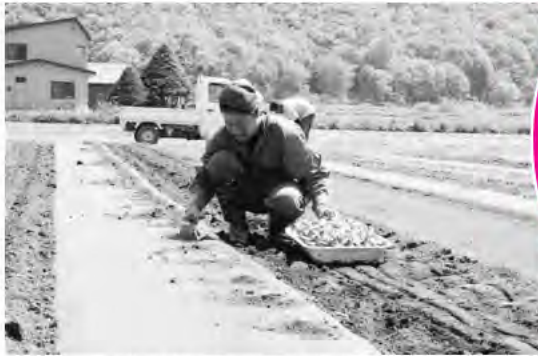
伏古地区 伏古生産組合