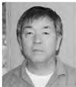
係 (準)黒田 武 堆肥センター業務