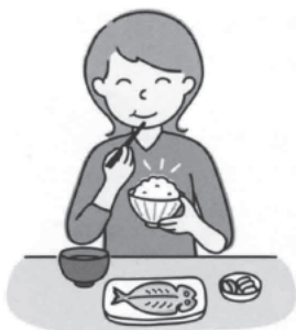
ご飯を多めに食べて、副食は少なく取るのが、日本型食生活の基本。60年代後半にはこんな食卓が多く見られました

日本にファストフード店の1号店が誕生したのが1970年。今やすっかり全国区でなじみの味となりました。 店舗数の拡大と比例してか、日本の食生活は70年代後半を境に変わっていきます。国民1人当たりの熱量比率を見ると、70年代後半から脂質の割合が上昇し、反対に炭水化物の割合が減少します。 この脂質と炭水化物のアンバランスが引き起こすのが「朝、缶コーヒーを飲まないしシャキッとしない」「朝ご飯は菓子パンとジュース」という現象です。朝から体が甘いものを欲するのは糖質不足によるもの。糖質