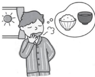
糖質が欲しくなる朝。早起きしてご飯を食べれば、缶コーヒーや菓子パンへの出費が減るかもしれません

【全体運】 のんびり気分で過ごす期間です。周囲への気配りを発揮すれば、人気運アップへ。交際費も実りのあるものに 【健康運】 足湯や入浴を楽しむと、健康回復効果大 【幸運を呼ぶ食べ物】 すき焼き