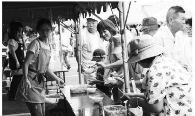
そば試食コーナー