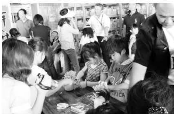
なめこの収穫体験