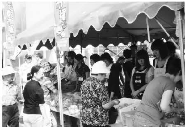
たくさんの人で賑わう朝市