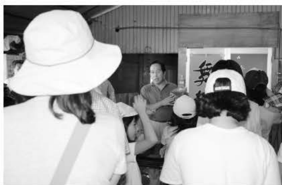
舞茸ができるまで (有)きのこ工房宮本