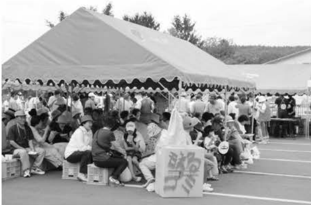
たくさんの来場者で賑わいました