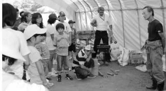
椎茸ができるまで