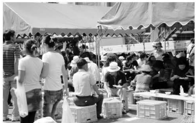
会場を訪れたたくさんの人々