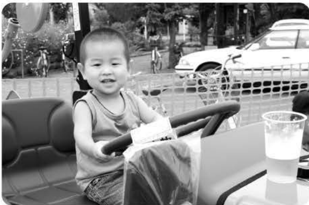
農機展示コーナー