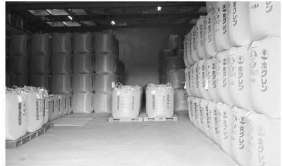
製品となった平成22年産米