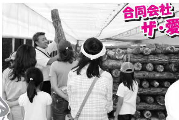
合同会社ザ愛別さんさん