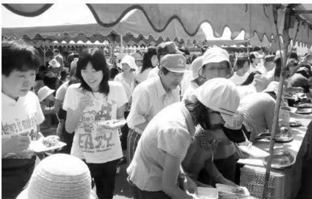
おいしい焼肉コーナー