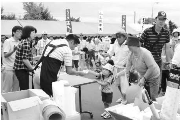
ビンゴゲームで景品交換