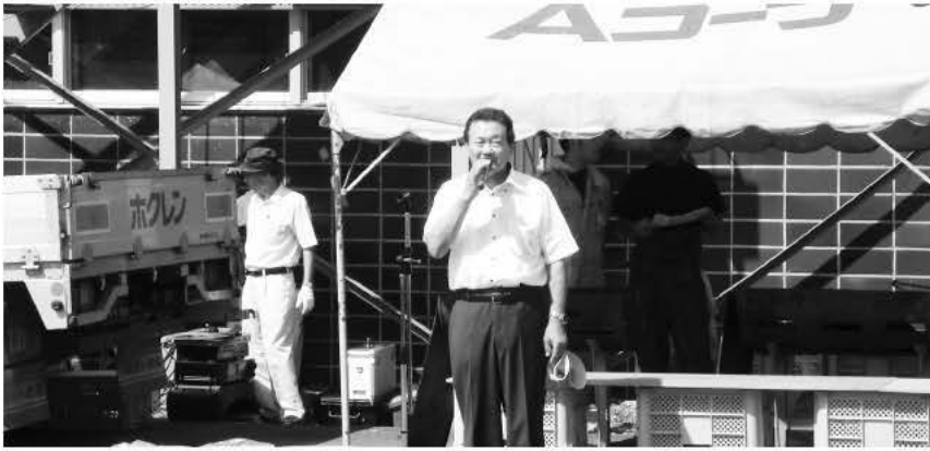
新井組合長より開会挨拶

たくさんの人で賑わう朝市やそば・きのこ汁の試食、もちまき・ビンゴゲーム、玉入れなどの催しが行われ参加した皆さんで交流を深めました。