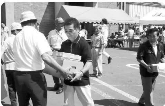
ビンゴゲームでの景品交換