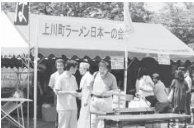
上川町ラーメン日本一の会