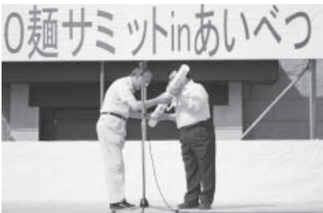
麺サミットバトン渡し