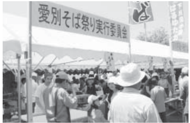
愛別そば祭り実行委員会