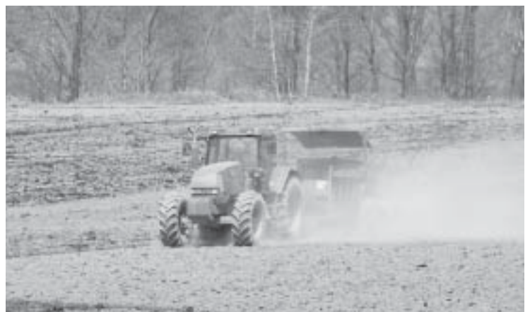
堆肥散布 上川地区 グリーンサポート