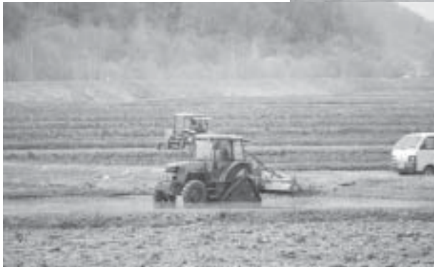
代掻き 愛別地区 協和農産