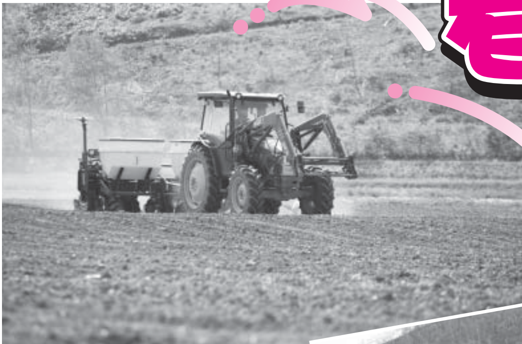
デントコーン播種 愛別地区 スリーエー生産組合