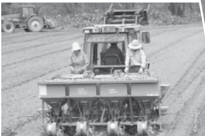
馬鈴薯植付 上川地区 馬鈴薯生産組合