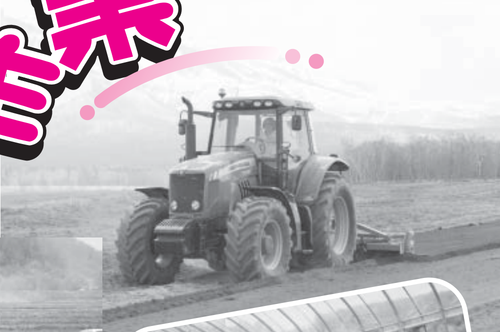
畑起こし 上川地区 大根生産組合