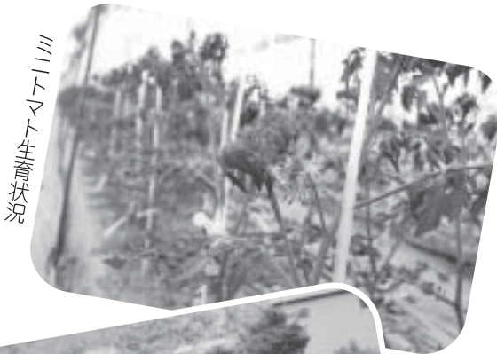
ミニトマト生育状況