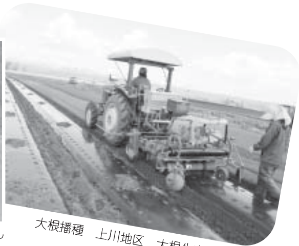
大根播種 上川地区 大根生産組合