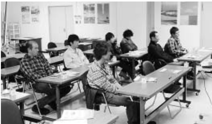
グリーンパートナーでの研修

2日目はホクレン農業総合研究所で作物の生産技術に関する研究の状況や食品加工の開発について研修を受けました。今回の研修を通して、野菜の品質向上に向けた取組みや加工技術について学んだ事を今後に生かしたいと思えます。