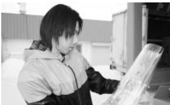
小ねぎを検品しています