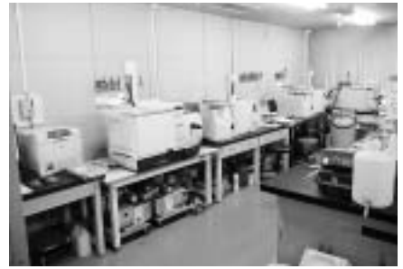
ホクレン農業総合研究所にて