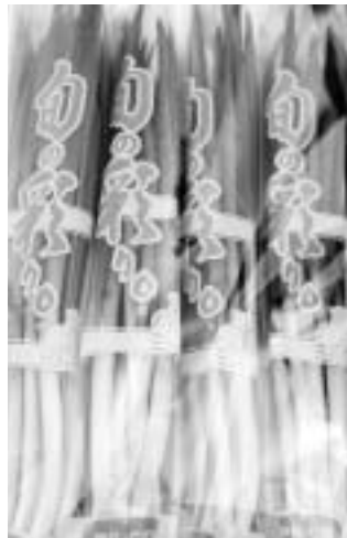
出荷された小ねぎ