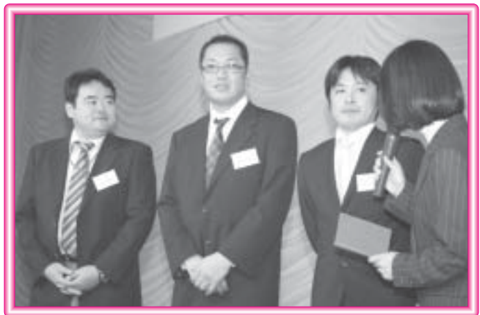
インタビューの様様