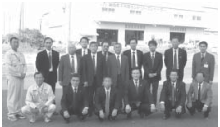
J A さがカントリーエレベータ前にて

今回の視察研修を通じ、当JAにおいても将来を見据えた農業基盤強化に取り組んで参りたいと思います。