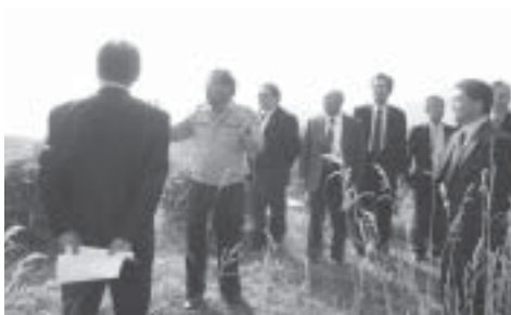
間社長の説明を受ける一同