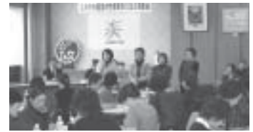
新役員のみなさん