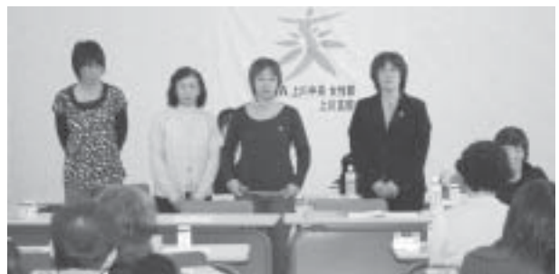
新役員のみなさん