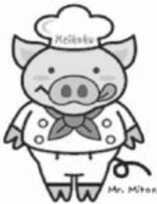
「溪谷・味豚」のイメージキャラクター ミスターミトン