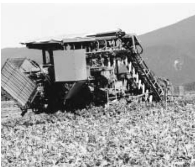
上川菊水地区 大根生産組合