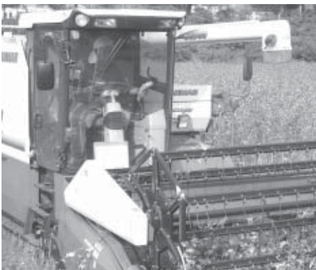
愛別中央地区 そば刈取り