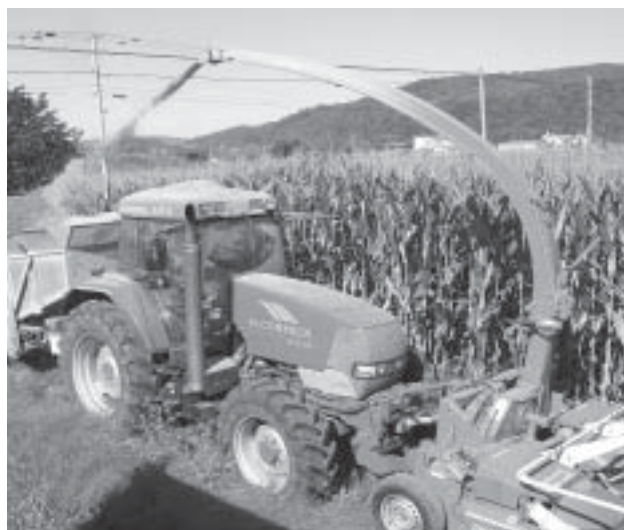
愛別地区 スリーエー生産組合 デントコーン刈取り