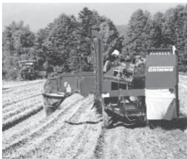
上川菊水地区 馬鈴薯生産組合