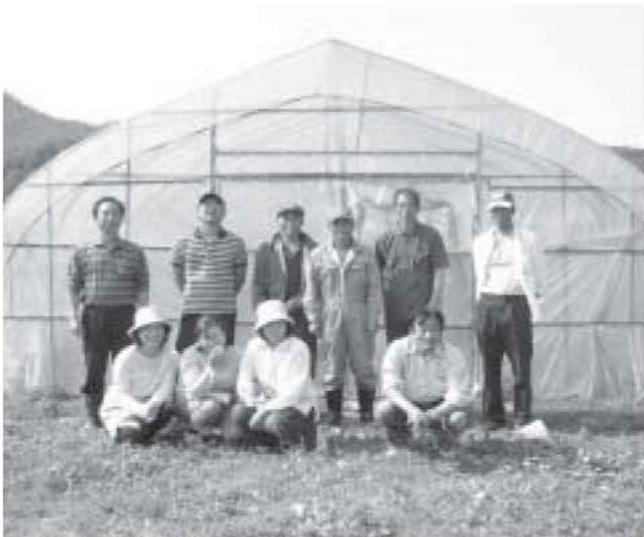
6月18日 米ナス出荷規格検討会・現地研修会 (有協和農産圃場)