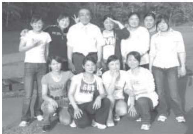
6月18日 愛別地区研修生 (北町バーベキューハウス)