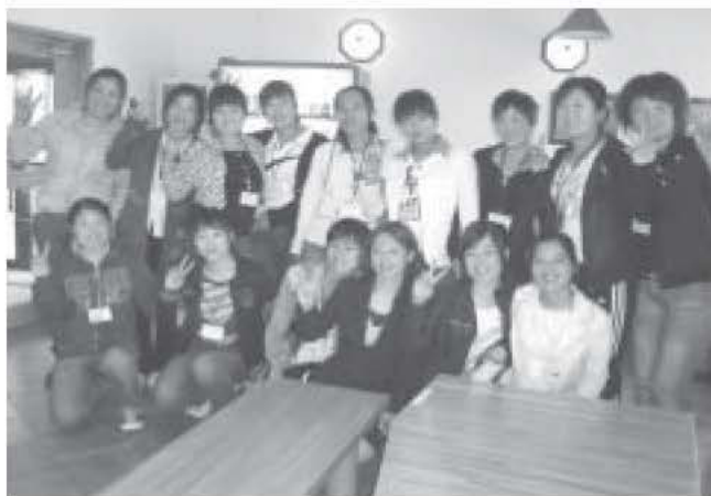
5月27日 上川地区研修生 (レストランベレル)