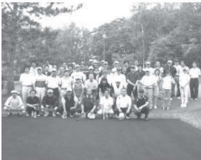
参加者全員で記念撮影

関係機関の皆様本当にありがとうございます。来年は六月十日に開催を予定していますので、宜しくお願ひ申し上げます。