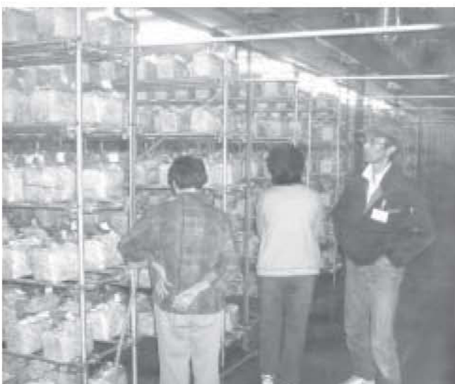
6月20日 舞茸現地研修会 (農事組合法人タッグ)