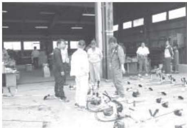
6月2日 本所 農機センター